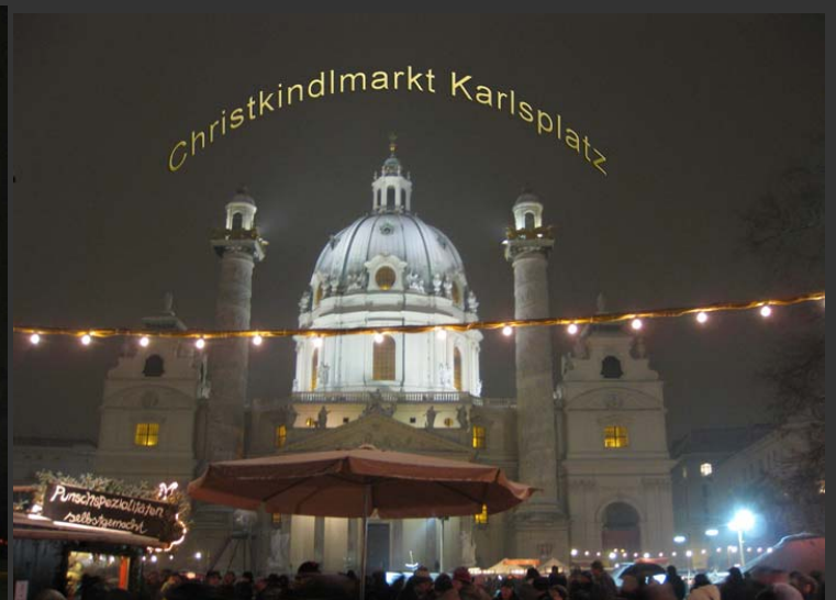
Vánoční trh na náměstí Karlsplatz